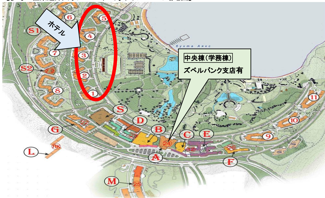
【参考：極東連邦大学ルースキー島キャンパスの略地図】