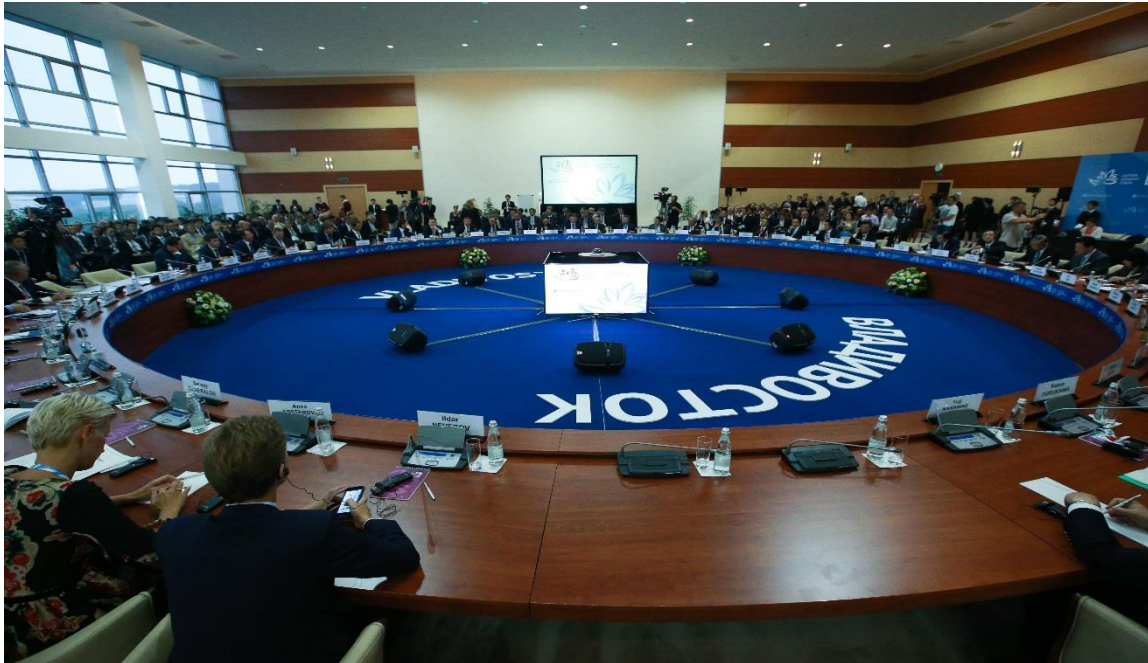
*2016年実施の第2回東方経済フォーラム・日ロビジネスラウンドテーブルの様子