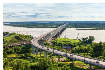
アムール川とアムール鉄橋