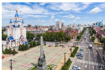
ハバロフスク市のメイン通り