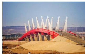
開通間近の中露間アムール川横断橋