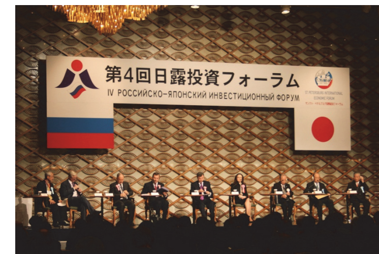
IV Japanese-Russian Investment Forum IV Российско-Японский инвестиционный форум